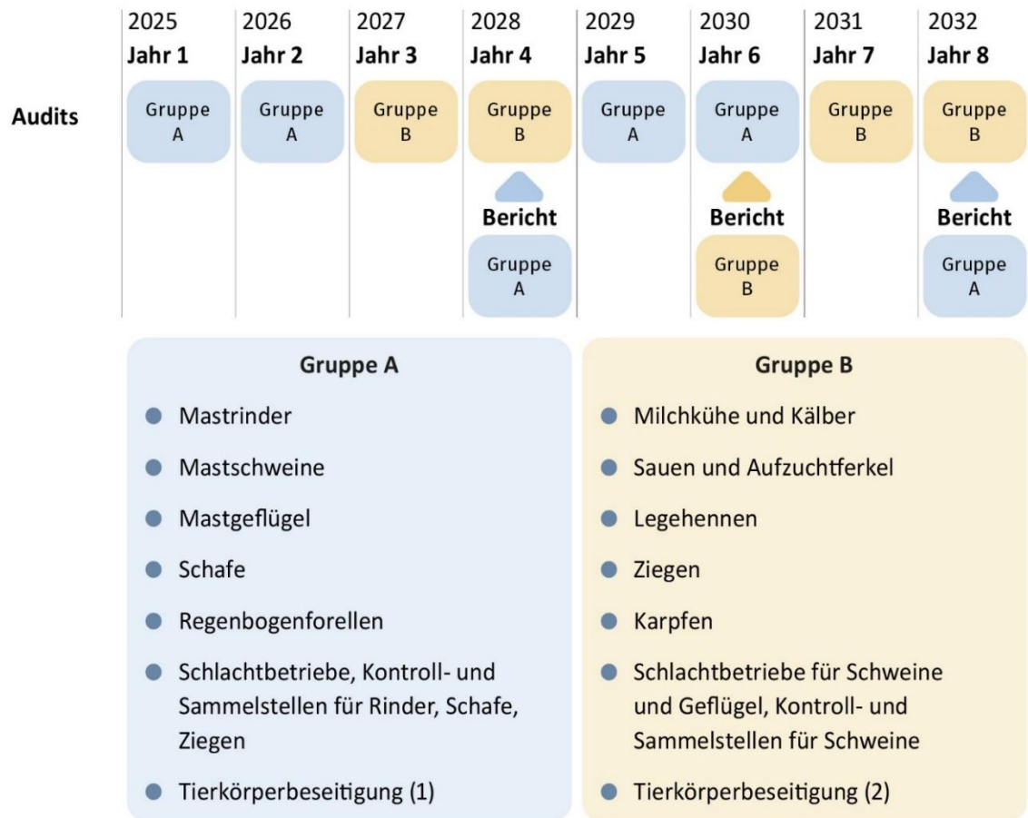
Abbildung 2: Aufteilung Monitoring nach Tierarten und Nutzungsrichtungen

Quelle: Empfehlungen für die Einführung eines nationalen Tierwohl-Monitorings, Bergschmidt et al., (2023)