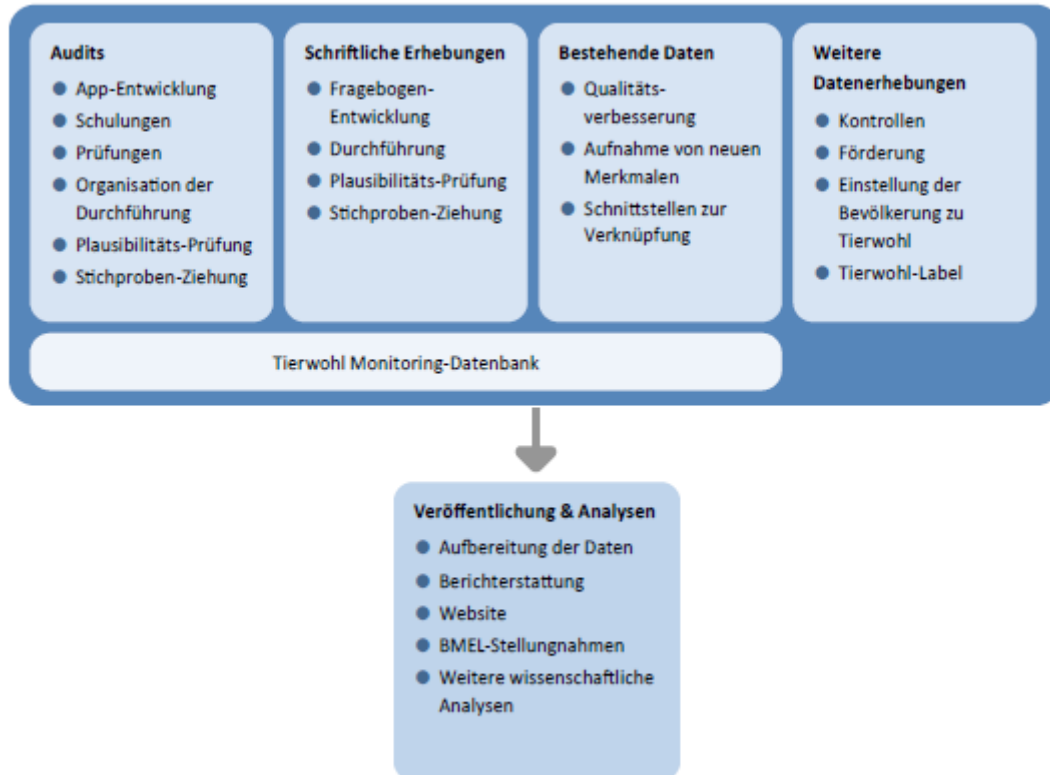
Abbildung 1: Aufgaben bei der Umsetzung eines zukünftigen nationalen Tierwohl-Monitorings